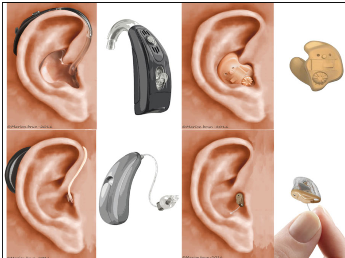
Abbildung 4: Derzeitige Hörgerätearten: Hinter-dem-Ohr-, Mini-Hinter-dem-Ohr-, Im-Ohr-Hörgeräte und Gehörgangsgeräte (© Marion Brun – 2016).

Aktuell stellen konventionelle Hörgeräte die Behandlung erster Wahl zur Rehabilitation von altersabhängiger Schwerhörigkeit dar. Derzeit sind Hinter-dem-Ohr- (HdO), Im-Ohr-Hörgeräte (IdO, in der Ohrmuschel) und Gehörgangsgeräte (CIC, im Gehörgang) erhältlich (Abb. 4). Bei Presbyakusis wird am häufigsten die «offene» Hörgeräteversorgung gewählt, d.h. es werden Hörgeräte eingesetzt, die den äusseren Gehörgang nicht verschliessen, um einen Okklusionseffekt (Widerhall der eigenen Stimme) bestmöglich zu vermeiden. Ferner gibt es sehr kleine Empfänger-im-Gehörgang-Hörgeräte (3–4 cm) («geschlossene» Hörgeräte), die